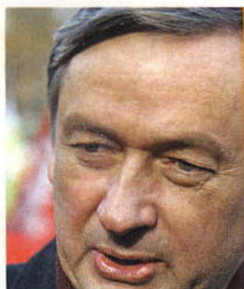
Dr. Danilo Türk, predsednik republike:

liberalizacija trga bolj namišljena, saj večino trga električne energije obvladujejo državna elektrogospodarska podjetja, ki se še naprej vedejo monopolno (konkurenca je po obsegu zanemarljiva). Zaradi kartelnega dogovarjanja pri zviševanju cen za gospodinjstva je z visokimi kaznimi vseh pet elektrodistribucijskih podjetij oglobil urad za varstvo konkurence.